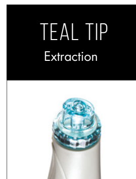
TEAL TIP Extraction