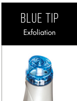
BLUE TIP Exfoliation