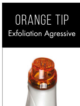
ORANGE TIP Exfoliation Agressive