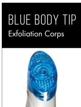
BLUE BODY TIP Exfoliation Corps