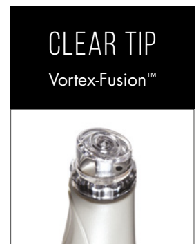
CLEAR TIP Vortex-Fusion™